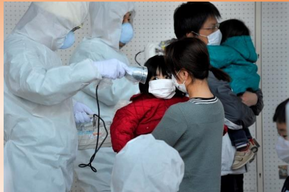
測りきれない将来への不安(福島) 森住卓

広島、長崎の原爆、核実験、原発、ウラン鉱山などは世界に無数のヒバクシャを生み出し、福島で再び悲劇は繰り返されました。こうして世界各地のヒバクシャを撮り続けてきた六人の日本人写真家の写真による世界ヒバクシャ展は、ブラジルの国際会議や、台湾、韓国など、海外でも大きな反響を呼んできました。戦後70周年の今年、広島、長崎、そして世界のヒバクシャの思いをぜひ感じてください。世界百力国での写真展開催に向けて、ご支援・ご協力の輪が広がることを願っております。